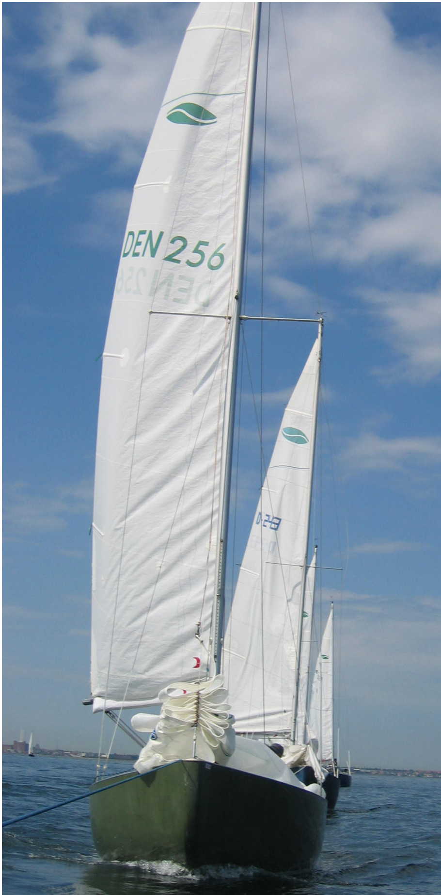
Svag vind ved DM 2004